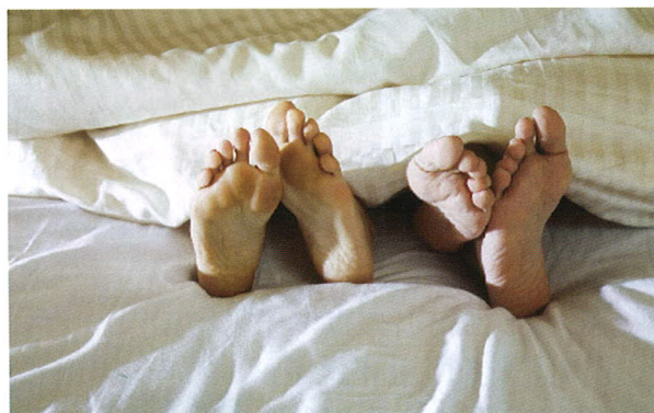
㊦ 患者要控制性生活的頻度。

調理方面，要注意外陰清潔，避免病菌感染；注意經期保健，避免經期性生活，以免生殖系統感染及抗精子抗體產生；保持樂觀情緒，控制性生活的頻度，使月經正常規律。 ㊦